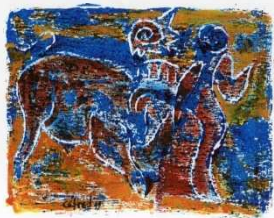
Mano a Mano

"La tête à tête taumachique" ou cérémonial pour deux danseurs et une voix.